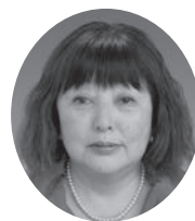
公益社団法人 埼玉県手をつなぐ育成会

この間、全日本手をつなぐ育成会の解散、育成会連合会の立ち上げ、東日本大震災、連合会副会長就任、県育成会結成60周年記念大会、公益社団法人格取得等、大きな出来事を経験させていただきました。しかし、猛省しなければならぬことは、就任時の会員数2800人を2200人まで減らしてしまっただけです。組織の活性化や、育成会活動の意義啓蒙など必要性を会員の皆様に訴えてきたつもりですが、力及ばず会員減少の波を止めることが